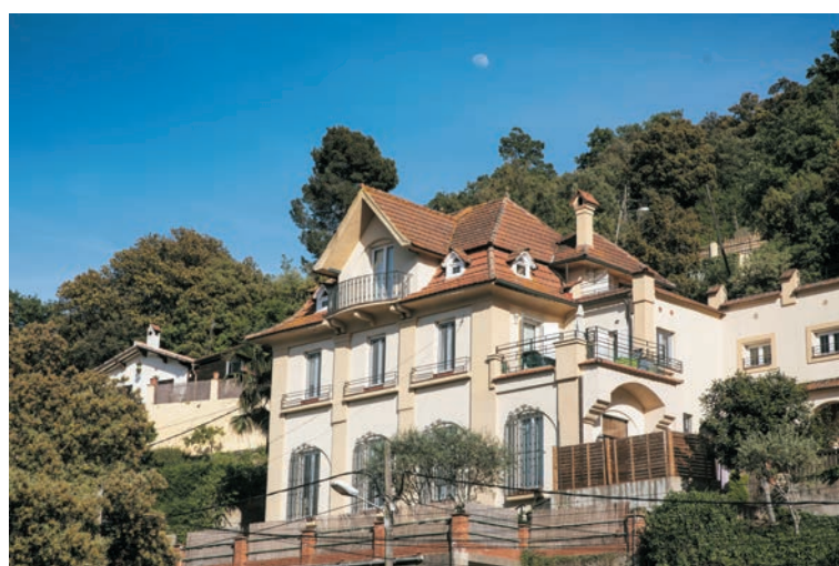
Sanatori del Fumet

Obra inspirada en l'arquitectura centreeuropea del mestre d'obres Josep Graner i Prat, que en 1926 el va alçar per encàrrec d'un metge d'origen alemany com a sanatori per a malalts de tuberculosi. El jardí mostra una interessant successió de terrasses i desnivells amb alzines i pins. Aquest xalet no va arribar a fer mai aquesta funció a causa de l'esclat de la Guerra Civil.