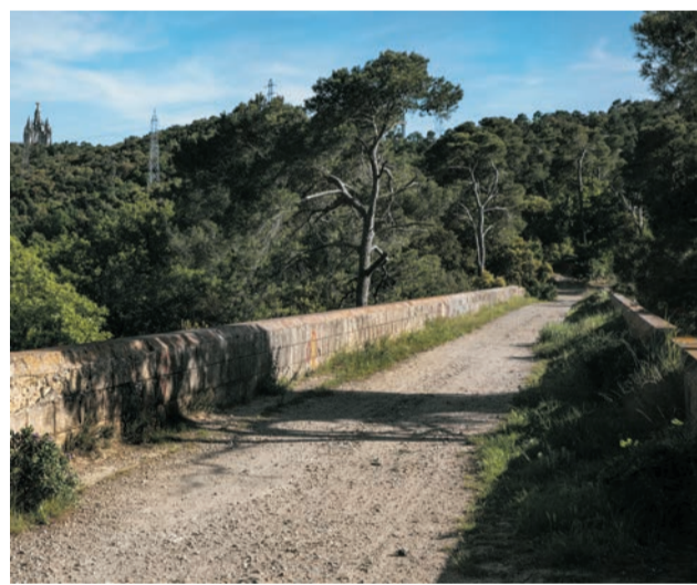
Viaducte de Can Ribes

Conjunt de tres fonts en una gran esplanada. La construcció és de pedra arrebossada de ciment que té tota l'alçada del marge i agafa unes formes voluminoses i irregulars que recorden la Pedrera.