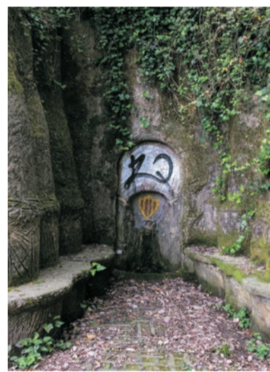
Font de la Rabassada