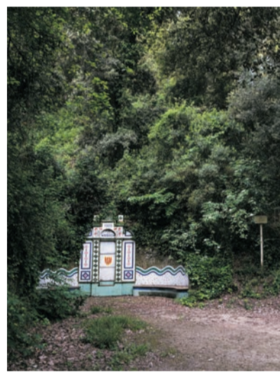
Font de Can Ribes