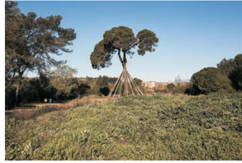
Pi d'en Xandri

Es troba a la vall de Gausac i al mig del camí tradicional de Sant Cugat a Sant Medir. L'estructura actual de la masia correspon a la masia del segle XVIII. Molt a prop, es troba el pantà de Can Borrell, que recollia aigua per ser conduïda a la bassa de la masia per a usos agrícoles.